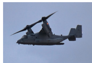
よく落ちるオスプレイ

ですから神は目に見えない、だから神を理解しなくても、その存在を信じなくても仕方がない、という論理に関して聖書はあっさりと 「彼らに弁解の余地はないのです。」 と語ります。そんな屁理屈は通らない、と語るのです。ぜひ正しく真理を見ていきましょう。