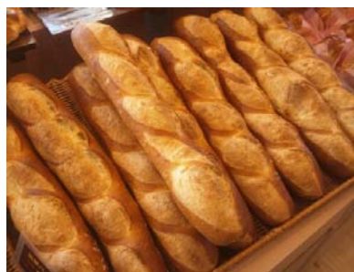
パンを水の上に投げる

私たちはこんな活動をもう何年も行っているのですが感謝なことには、それが全くの無駄にはならず、少しずつですが分かる方も現れてきています。このような働きに携われることは感謝です。