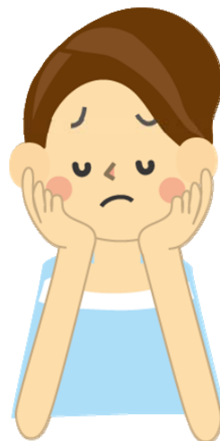
思い煩いを神に委ねる

そして自分の弱さを損と思っていたことが、かえって益となりました。自分の弱さを知り、そのことを受け入れた時、上記、第一ペテロの手紙5章7節のみことばが、はじめて自分を生かすことばとなりました。自分の弱さよりも、むしろ神のことばを全面的に受け入れていなかった自分の頑なさに問題があったことに気付かされました。真の解決者である神さまに感謝します。