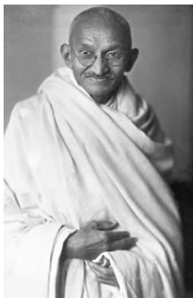
マハトマ・ガンジー