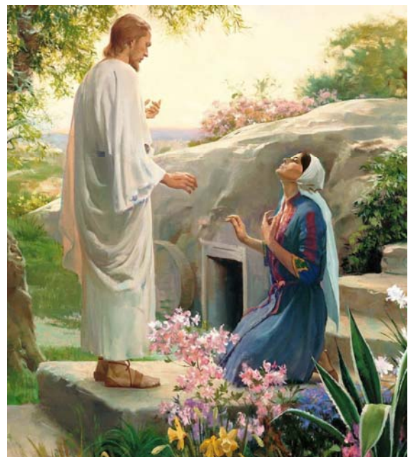
三日目によみがえられて、マグダラのマリヤの前に現れたイエス・キリスト

10:9 なぜなら、もしあなたの口でイエスを主と告白し、あなたの心で神はイエスを死者の中からよみがえらせてくださったと信じるなら、あなたは救われるからです。 10:10 人は心に信じて義と認められ、口で告白して救われるのです。